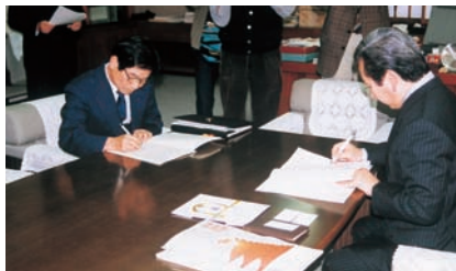
1998年高知県との災害時物資供給協定の調印

域の生協による被災地支援活動などの訓練を行います。このような図上演習は各地の生協でも取り組まれており、2011年3月に発生した東日本大震災では、全国の生協のネットワークによる物的・人的両面での組織的支援が高く評価されました。