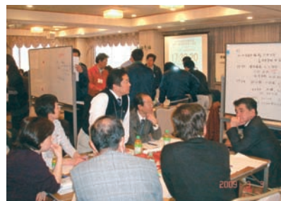
中四国の生協で行っている災害対応図上演習