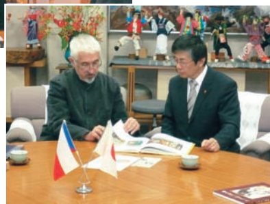
招待画家による 岡崎高知市長表敬訪問