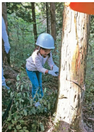
チェーンソーとノコギリで間伐体験。木が倒れる度にあちこちで歓声があがっていました。

コープ自然派こうちでは、土佐町の方々と生協取扱商品を通じて様々な活動に取り組んできています。土佐町の低農薬米「吉野川源流米」は、コープ自然派こうちを含む四国や関西の10生協が参加するコープ自然派事業連合に供給されており、環境を考えた米作りをする生産者を支えるための年間予約登録制度などもあります。また、コープ自然派事業連合では2007年2月14日より高知県、土佐町、土佐町下地藏寺部落との間でパートナーズ協定を締結し「環境先進企業との協働の森づくり事業」として間伐体験や山桜の植樹を行うことにより森林の再生と土佐町の地域のみなさんとの交流となる取り組みを進めており、毎年秋に開催している「源流米稲刈り&コープ自然派の森林間伐ツアー in 土佐町」には、2011年度も大人23名、子ども11名が参加しました。