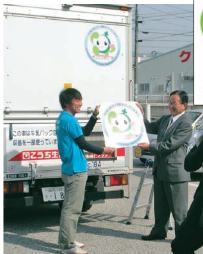
ステッカーを貼った配送車の出発式