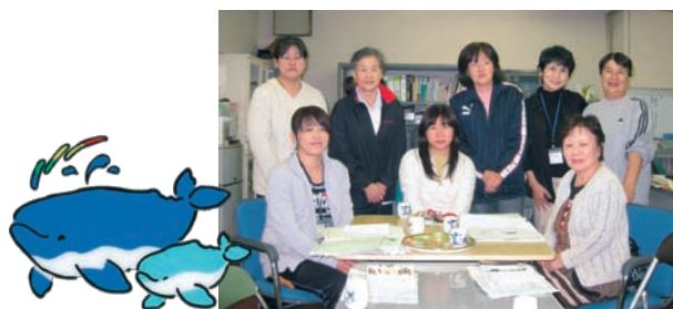
高知県庁生協介護福祉センターのスタッフ一同

利用者からは「生協がやっているから安心」「名前に県庁がついているからきちんとしているはず」というような信頼と期待が感じられます。地域の中での「生協」に対する信頼は、県庁生協を含む様々な生協のこれまでの実績により築かれてきたものであり、「生協」のネームバリューに恥じないような、よりよい介護を実現しなければならないと考えています。コンプライアンスにはとくに厳しく注意を払い、スタッフの資質向上のための研修等にも積極的に取り組んでいます。また、働きやすい職場づくりを心掛け、スタッフの信頼関係とチームワークによって、利用者が住み慣れた家でできるだけ自立した生活を継続できるよう支援しています。