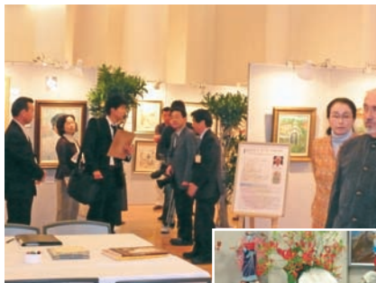
ユニセフチャリティ絵画展の会場の様子

のご来場があり、大勢の方に楽しんでいただいています。2011年度も2012年2月3日(金)～5日(日)に『高知市文化プラザかるぼーと』で開催する予定です。たくさんの方々に楽しんでいただけたらと思っています。