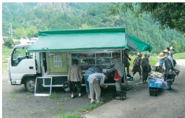
班会の前に移動販売車を利用する物部地区の組合員さん

物部だけではなく、県内には至る所同じような地域が増えていきます。このような医療生協の活動が全県で広がり、地域で暮らす人達の命と暮らしを守る活動の一助になればと考えています。