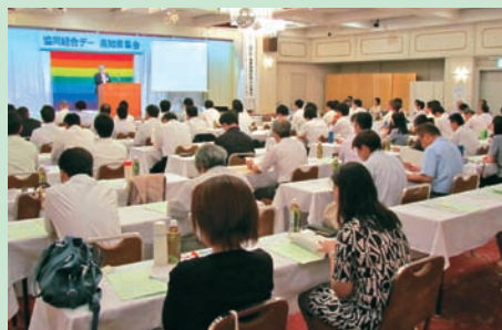
2011年7月に開催された国際協同組合デー高知県集会

毎年7月の第1土曜日は、「国際協同組合デー」です。高知県内でも、毎年その時期に、高知県生活協同組合連合会、JAグループ高知、高知県漁業協同組合連合会、高知県森林組合連合会の主催により、「国際協同組合デー高知県集会」を開催しています。協同組合運動に携わる人々が一堂に集い、協同組合の価値と役割を再確認するとともに、平和とよりよい生活の実現をめざして運動の前進を誓います。