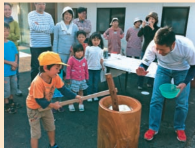
地元の方の協力で餅つきも楽しみました。

翌日は、地元の方が作ってくださった色とりどりの愛情と野菜たっぷりのおかずと炊き立ての源流米での朝ごはんをいただきました。間伐体験では、県職員の方や地元の方の指導のもとで、直径20～30センチくらいのヒノキを間伐していきました。昼食は土佐町の町並みや棚田が一望できる山の頂上へ移動し、竹筒に入った郷土寿司と竹筒で作ったコップでいただいた温かいお茶が空腹を満たしてくれ、充実した2日間を締めくくってくれました。