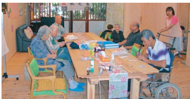
「憩のひろば しばてんハウス朝倉」

会では、92歳のデイサービス利用者の方が主体となって職員と一緒にちらしずしを作ってくれました。生協組合員にはわらじ作りの名人もいますし、教員経験者もいます。お年寄りの方は、たくさんの知恵や経験をお持ちです。それらを引き出して、お年寄り子どもたちが一緒に出来る場面を作り、高齢者が主人公となって世代間交流の場を作りたいと考えています。年末には餅つきを、夏休みには子ども教室ができるのでは、などと夢が膨らんでいます。